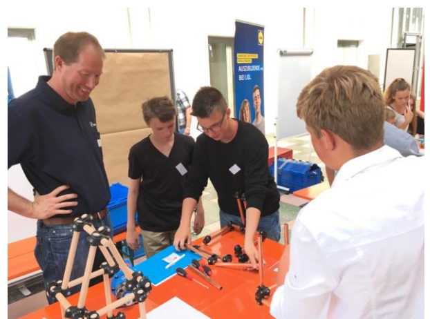
Hänchen beim IHK-Berufsparcours in Nellingen, 22.06.2017