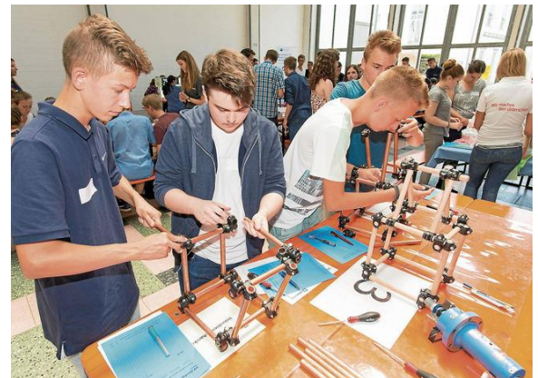
Das „Viehhaus“ am Stand von Hänchen, IHK-Berufsparcours, 22.06.2017

So sieht modernes, effektives Arbeitgebermarketing aus.